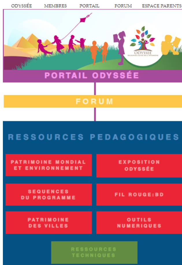
Une capture d'écran de la plateforme